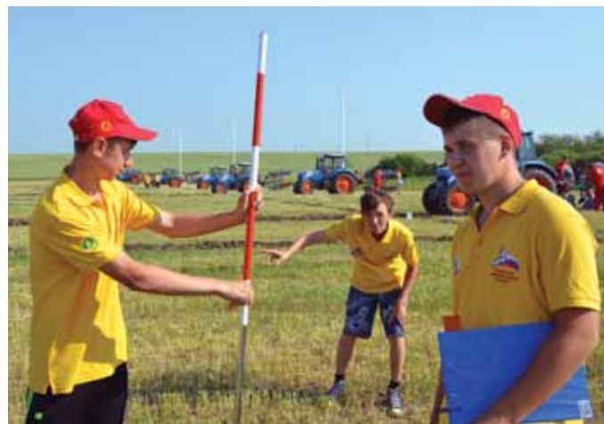
Судьи строго выверяли каждый сантиметр