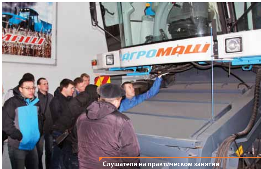
Слушатели на практическом занятии