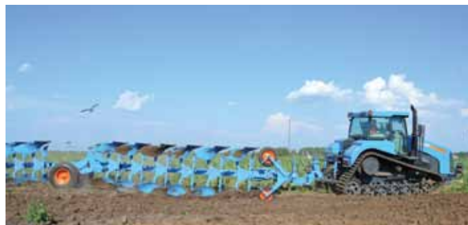
АГРОМАШ-Руслан тоже показал мастерство на суздальском поле