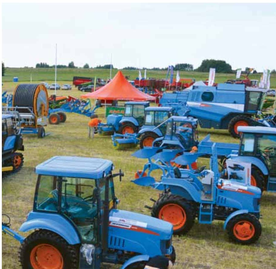
Объектив фотокамеры не смог охватить всю выставочную экспозицию «Агромашхолдинга»

— Тракторостроение — очень серьезное направление промышленности региона. У нас 30-31 мая прошел экономический форум «Владимирская область — территория динамичного развития», который сопровождался обширной выставкой, в том числе была представлена и наша техника.