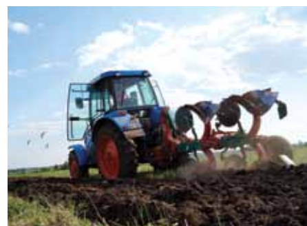
На суздальском поле — владимирские тяжеловозы и «железные кони»