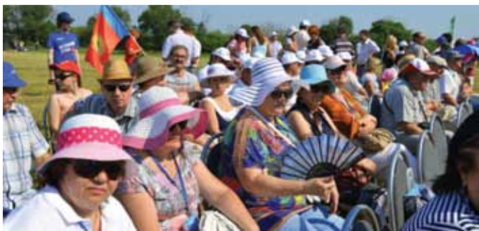
В жаркий день шляпа украшает и защищает дам

Известная поговорка «Когда пашут — руками не машут»